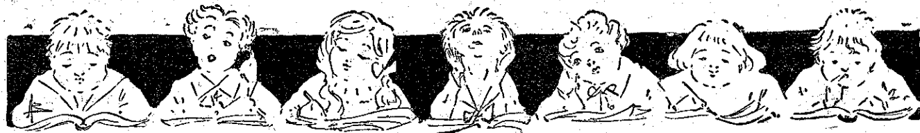
Ίδε τον Όδηγόν του Σελίς ΣΥΝΕΡΓΑΣΙΑΣ ΣΥΝΔΡΟΜΗΤΩΝ Συνδρομη- του, Κεφ. Β'